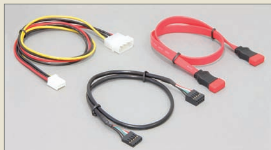
eSATApd (Power Over eSATA Dual)