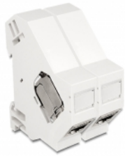
Anwendungsbeispiel mit Stecker