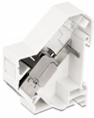
Anwendungsbeispiel mit Stecker