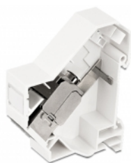
Anwendungsbeispiel mit Stecker