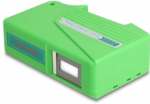
cleaning of fiber optic connectors