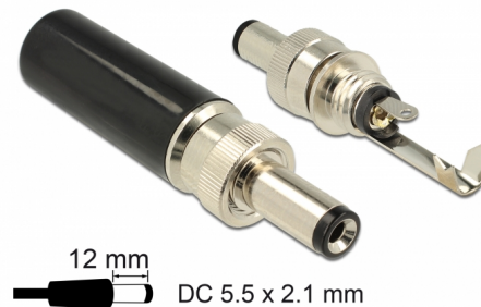
12 mm DC 5.5 x 2.1 mm

Αυτός ο σύνδεσμος DC της Delock είναι φτιαγμένος για τη συγκόλληση σε ένα καλώδιο και μπορεί να χρησιμοποιηθεί για τη σύνδεση διαφορετικών συσκευών με υποδοχή 5,5 x 2,1 χιλ. DC. Ο σύνδεσμος με τη βίδα στην υποδοχή υποστηρίζει σφιχτή σύνδεση με τις κατάλληλες υποδοχές DC.